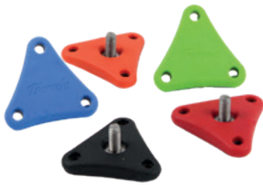
VITI A MANOPOLA