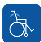
Reclinación de respaldo ▼