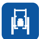
Peso total ▼