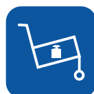
Peso de transporte ▼