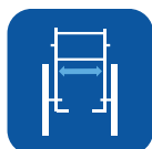
Anchura asiento ▼

Para obtener información más completa acerca de este producto incluyendo el manual del usuario, consulte la página web www.invacare.es