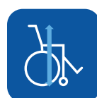
Altura total ▼