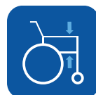
Altura reposabrazos ▼