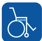
Profundidad asiento ▼