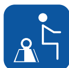
Peso máx. usuario ▼