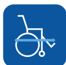
Largo total con reposapiés** ▼