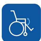
Ángulo de asiento ▼