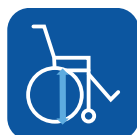
Altura asiento ▼