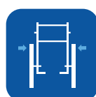
Anchura total ▼