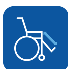
Regulación de los reposapiés ▼