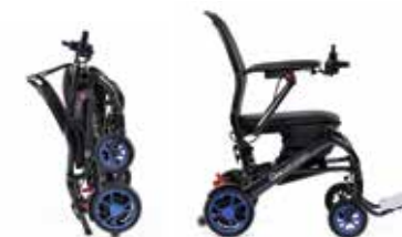
Q50 R Carbon

Silla de ruedas plegable de carbono, con batería de litio.