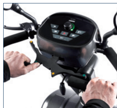
Panel de control táctil y waterproof que ofrece un ajuste sencillo de la velocidad, indicador de batería de LED y bocina.