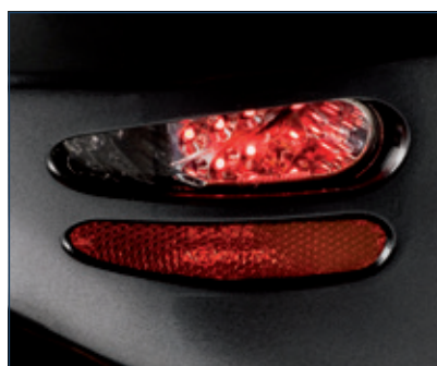
Luces de posición y frenado en la parte trasera.

Gracias a su avanzada tecnología de iluminación LED de bajo consumo, las luces de los scooters Serie-S son 400 veces más eficientes que las bombillas normales, lo que se traduce en un mayor ahorro de energía en la batería y por tanto una mayor autonomía de viaje. Así podrás disfrutar de tu scooter por más tiempo.