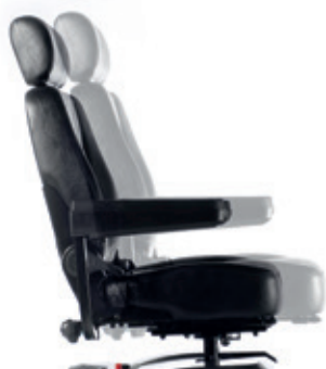
Asiento deslizante, ajustable en profundidad

Gracias al manillar ajustable con amplias empuñaduras ergonómicas, podrás encontrar fácilmente la posición de conducción que te resulte más cómoda. Con asiento y respaldo acolchado de gran calidad para ofrecerte el máximo confort en cada viaje. La unidad de asiento es ajustable en altura, ángulo y profundidad y los reposabrazos pueden ajustarse en anchura, ángulo y profundidad o abatirse totalmente para facilitar el acceso.