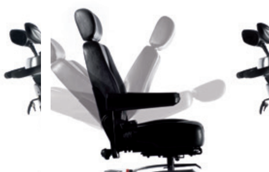
Ajuste sencillo del ángulo de respaldo