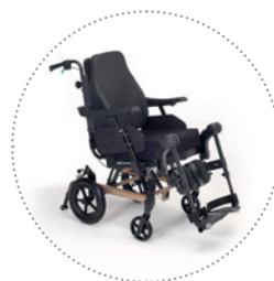
Clematis Pro Stock

Respaldo flexible con cojín anatómico Laguna II. Cojín de asiento Contour Visco NG . Barra de empuje ajustable en ángulo. Alto nivel de personalización gracias a numerosas opciones como el freno tambor disponible sin suplemento de precio.