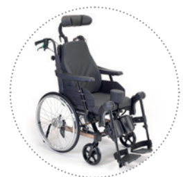
Clematis Pro Configurada