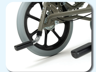
B77 - Antivuelcos