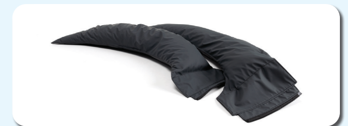
L71 - Reposabrazos extraíbles granulados