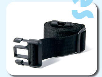
B20 - Cinturón de seguridad