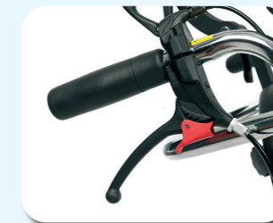
B74 - Frenos tambor