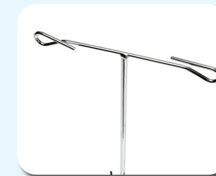
B52 - Portasueros