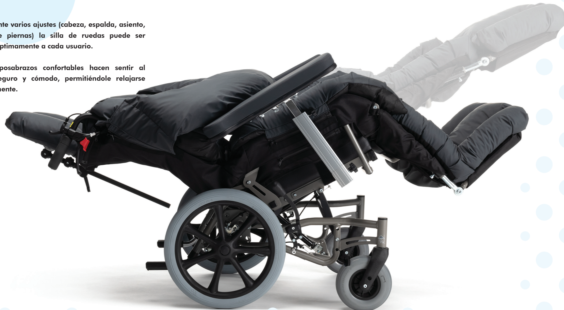
Posición de descanso personalizada gracias a las posibilidades de ajuste personalizado de asiento, respaldo, reposapiernas y reposapiés.