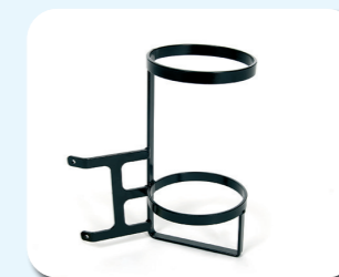
B83 - Soporte bombona