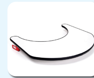
B12 - Mesa

Fácil separación de los compartimentos mediante cremallera