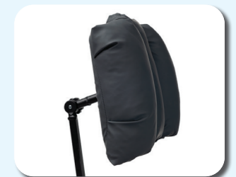
L58G - Reposacabezas confort