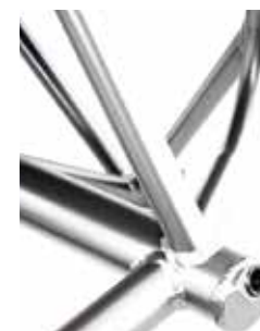
Tubo del eje integrado