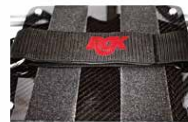
Reposapiés integrado con cincha pies

Y además, ruedas delanteras con rodamientos Bones Reds como standard. Reducen la fricción, minimizando la energía necesaria para propulsar la silla y facilitando la maniobrabilidad en el juego.