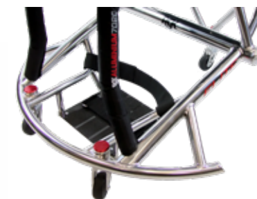
Horquilla de aluminio integrada, resistente y ligera.

Y además, ruedas delanteras con rodamientos Bones Reds como standard. Reducen la fricción, minimizando la energía necesaria para propulsar la silla y facilitando la maniobrabilidad en el juego.