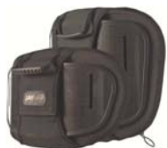
Torácico Inferior (LT)