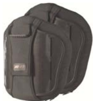
Torácico Medio (MT)