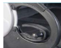
NSW040020 Adaptación tetrapléjia para reposabrazos de escritorio