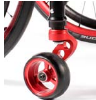
NSW080008 Horquilla de 1 sólo brazo en color