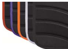
Colores ribetes tapicerías Exo y Exo Pro