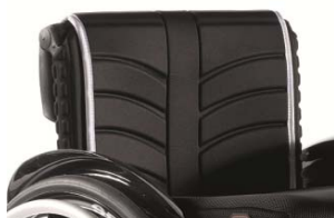
NSW30316 Tapicería de respaldo EXO