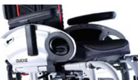
NSW040002 y NSW040004 Reposabrazos de escritorio ajustable en altura