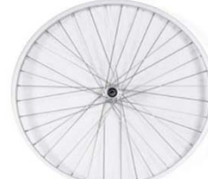
NSW070001 Ruedas c/radios cruzados