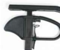
NSW040050 y NSW40051 Reposabrazos ajustables en altura estilo Quickie