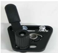
NSW060001 Freno standard