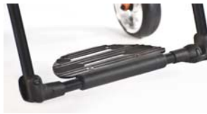
NSW050059 Plataforma única de aluminio Performance