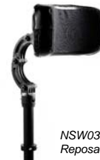
NSW030412 Reposacabezas mediano