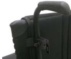
NSW030204 Empuñaduras ajustables en altura