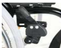
NSW060002 Freno de rodilla