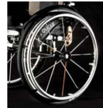
NSW70006 Ruedas Spinergy 12 radios