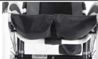
NSW020003 Tapicería de asiento con 2 bolsillos