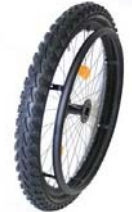
NSW70010 Ruedas Mountain bike