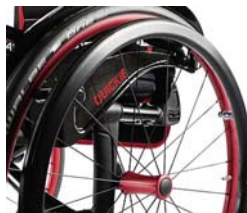
NSW070211 Aros Surge®