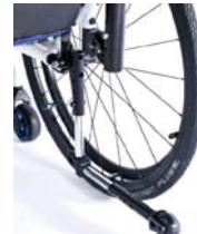
NSW090005 Rueda antivuelco, abatible