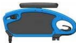
NSW040001 y MSW40003 Reposabrazos de escritorio fijos