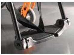
NSW050020 Plataformas individuales de composite