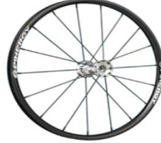
NSW70005 Ruedas Spinergy 18 radios