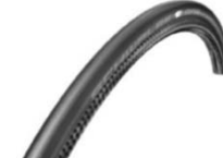
NSW070107 Schwalbe One