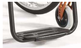
NSW050131 Plataforma única de composite