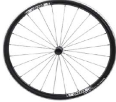
NSW70004 Ruedas Proton