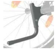
NSW090001 Tubo de cola