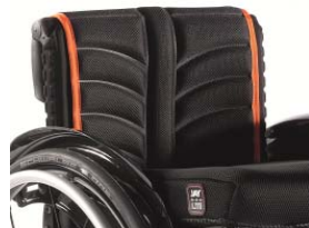
NSW030317 Tapicería de respaldo EXO PRO