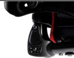
NSW030012 Respaldo ajustable en ángulo, no plegable