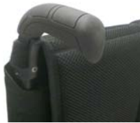
NSW030201 Empuñaduras standard largas