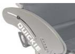
NSW040102 Protector lateral de aluminio (sin fender)