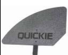
NSW040107 Protector lateral de composite