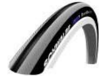
NSW070101 Right Run