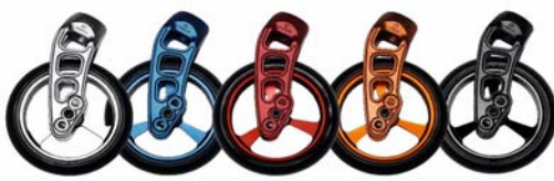
NSW080013 Horquillas Carbotecture en color NSW080306 llantas de aluminio en color