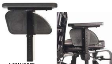
NSW40052 Reposabrazos ajustable en altura mediante herramientas