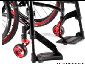
NSW050022 Plataformas individuales de aluminio