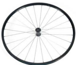
NSW70003 Ruedas ligeras