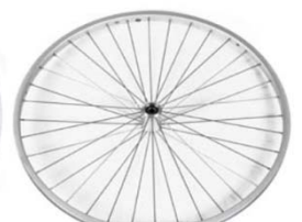
NSW070002 Ruedas de diseño