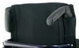
NSW030203 Empuñaduras plegables