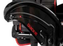
NSW040104 Protector lateral de carbono con fender