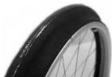
NSW070208 Aros Maxgrepp antideslizantes