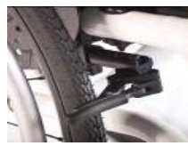
NSW060003 Freno compacto