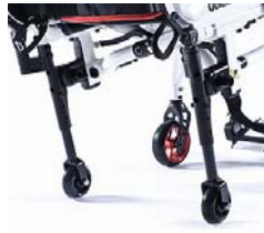
NSW090010 Ruedas de tránsito