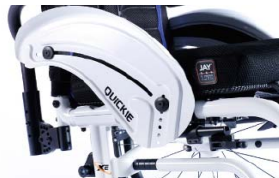
NSW040103 Protector lateral de aluminio (con fender)