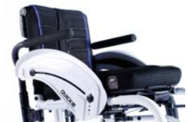
NSE040117 Reposabrazos tubulares acolchados