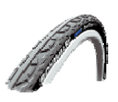
NSW070106 Doble perfil