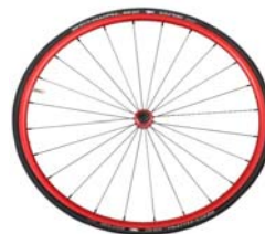
Colores anodizados en carrete y llantas, sólo para ruedas ligeras 24"