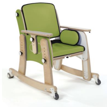
Base con Ruedas