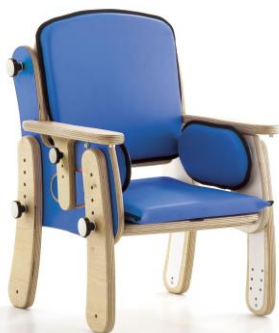
Base con patas