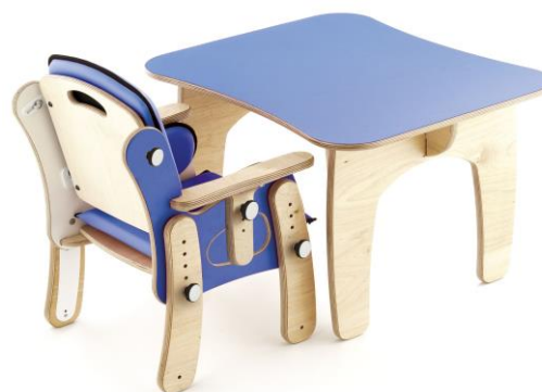
Mesa PAL 2 personas