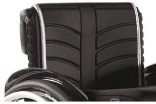
XFF 030316 Tapicería de respaldo EXO