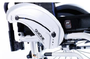
XFF040103 Protector lateral de aluminio (con fender)