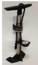
XFF090024 Bomba de alta presión