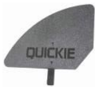
XFF040107 Protector lateral de plástico desmontable