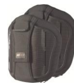
Torácico Medio (MT)