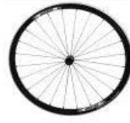
XFF07000 Ruedas traseras ultraligeras Proton