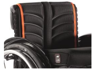
XFF 030317 Tapicería de respaldo EXO PRO