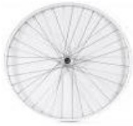
XFF070001 Ruedas traseras con radios cruzados