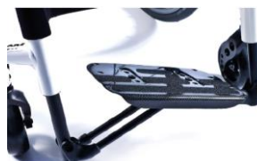
XFF050027 Plataforma autoplegable de carbono