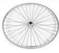
XFF070002 Ruedas traseras de diseño