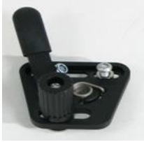
XFF060001 Freno standard