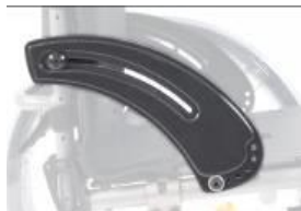
XFF040101 Protector lateral ligero pequeño