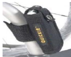
XFF090026 Soporte para móvil