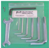
XFF090000 Kit de herramientas