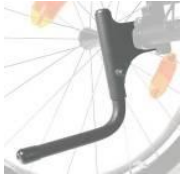
XFF090001 Tubos de cola