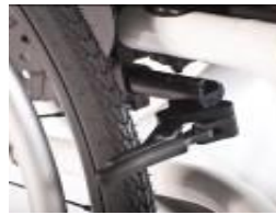
XFF060003 Freno compacto