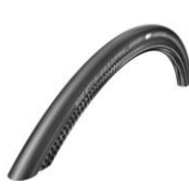
XFF070107 Cubiertas Schwalbe One