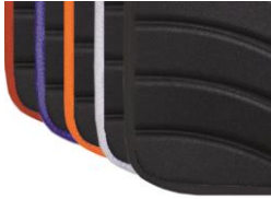
Colores ribetes tapicerías Exo y Exo Pro