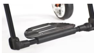
XFF050125 Plataforma de aluminio Xenon performance