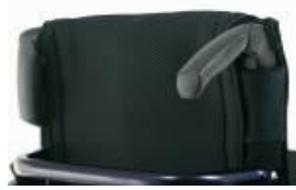
XFF 030203 Empuñaduras plegables