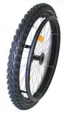
XFF07010 Ruedas traseras de Mountain Bike