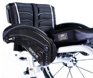
XFF040104 Protector lateral de carbono con fender