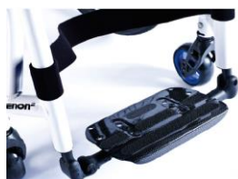
XFF050025 Plataforma única de fibra de carbono