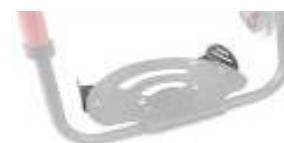
XFF050127 Posicionadores de pie para plataforma