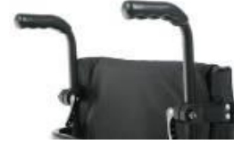
XFF 030204 Empuñaduras ajustables en altura