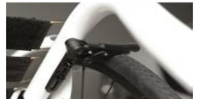
XFF060004 Freno compacto ligero