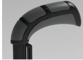
XFF 030201 Empuñaduras standard largas