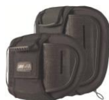
Torácico Inferior (LT)