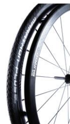
XFF070211 Aros Surge®