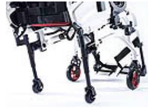
XFF090010 Ruedas de tránsito