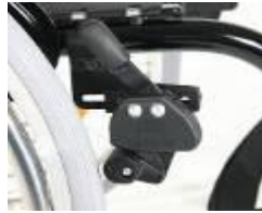
XFF060002 Freno de rodilla (montado alto)