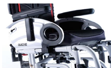
XFF04000x Reposabrazos de escritorio