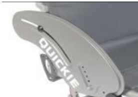
XFF040102 Protector lateral de aluminio (sin fender)