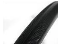
XFF070102 Cubiertas macizas