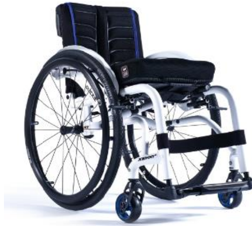
XFF090020 / 21 Armazón híbrido reforzado