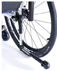
XFF090004 Ruedas antivuelco, abatibles