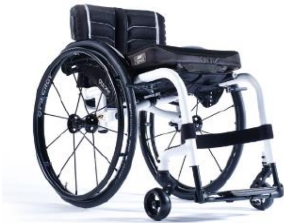
XFF010012 / 13 Armazón con reposapiés fijos