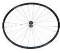
XFF070003 Ruedas traseras ligeras