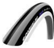
XFF070101 Cubiertas de alta presión lisas Right Run