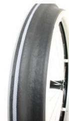
XFF070208 Aros Maxgrepp