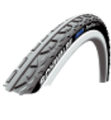
XFF070106 Cubiertas doble perfil