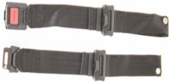
XFF 090018 Cinturón de posicionamiento con cierre