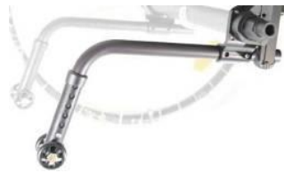
XFF090050 Ruedas antivuelco, no abatibles