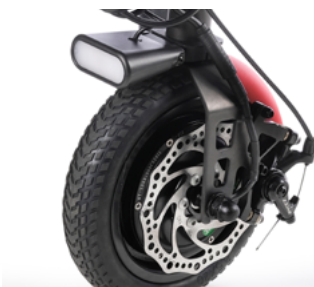
Luz delantera LED, guardabarros en rojo y freno de disco (mostrada en rueda maciza de 8,5")