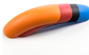
Kit de 4 colores para el guardabarros (incluidos de serie)