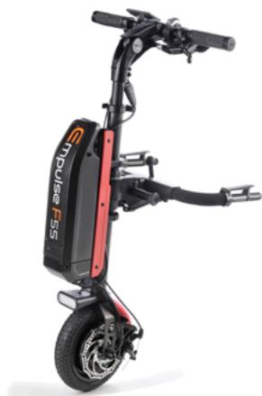
// EMF070085 Empulse F55 con rueda maciza de 8,5" (Mostrada con conexión para sillas con reposapiés fijos ref. EMF010027 y kit de color en rojo)