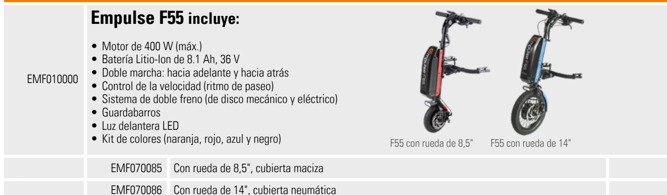
F55 con rueda de 8,5"