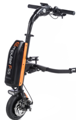
// EMF070085 Empulse F55 con rueda maciza de 8,5" (Mostrada con conexión para sillas con reposapiés desmontables ref. EMF010028 y kit de color en naranja)