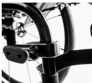
// EMF010029 Abrazaderas para sillas con tubos redondos (ajustable a tubos de 19.5 / 23 / 25 / 28.6 y 30 mm)