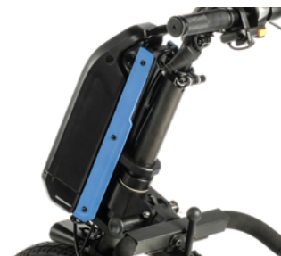
Kit de 4 colores para los laterales (incluidos de serie)