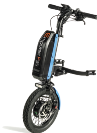
// EMF070086 Empulse F55 con rueda neumática de 14" (Mostrada con conexión para sillas con reposapiés fijos ref. EMF010027 y kit de color en azul)