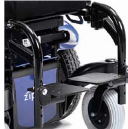
ZMM05062 Reposapiés abatibles a 90°