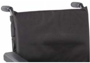
STR030301 Tapicería de respaldo Standard