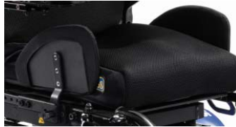
STR040142 Protectores laterales