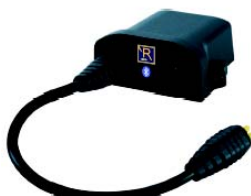
SAL090068 Módulo para Bluetooth