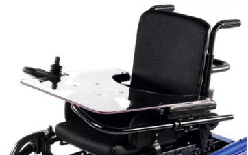
SAL090040 Mesa-bandeja abatible