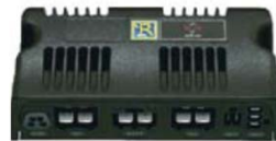
Caja de control 120 Amp