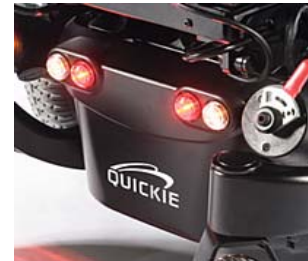
SAL110201 Luces de LED's