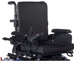
Conjunto asiento y respaldo Jay Comfort