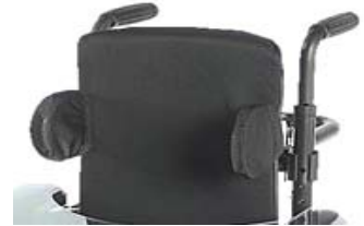
ZMM030598 Soportes laterales