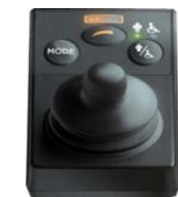
Mando de acompañante