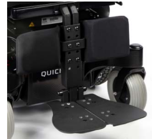
ZMM050112 Reposapiés centrales