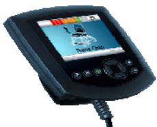
ZMM110101 Pantalla Omni