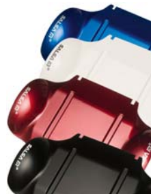
Colores Zippie Salsa M2 Mini