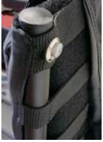
STR030213 Sin empuñaduras