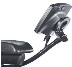
STR110110 Montaje flexible pantalla Omni