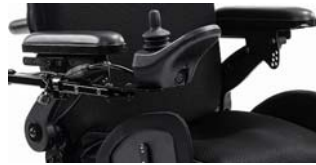
STR040122 Reposabrazos standard