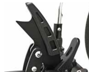
Sencillo sistema de liberación /instalación.