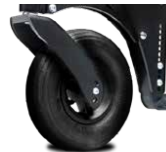
Rueda neumática de 200x50 con horquilla anti-vibración.