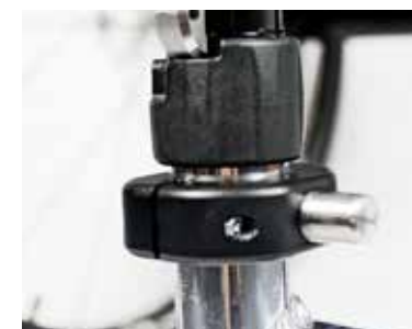
Compatible con las sillas Tiga, Tiga FX y Hi Lite.