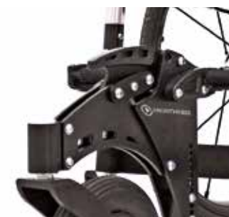
Robusto sistema con 3 puntos de anclaje en el chasis.