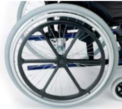
Ruedas con sistema de himpleja