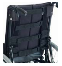
Tapicería nylon 4 cinchas