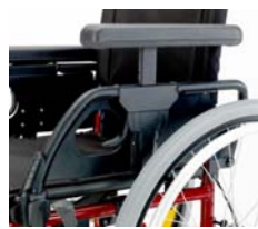
Ajustable en altura manualmente