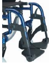
Reposapiés a 80°