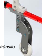
Ruedas de tránsito