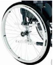
Ruedas macizas con cubiertas