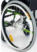
Ruedas macizas con freno tambor