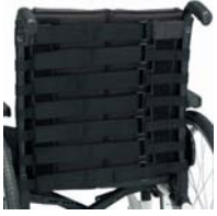
Tapicería nylon 7 cinchas