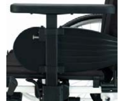
En forma de T, ajustables manualmente