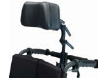
Reposacabezas de skay