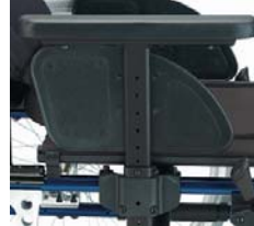
En forma de T, ajustables c/herramientas