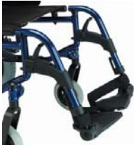
Reposapiés a 70°