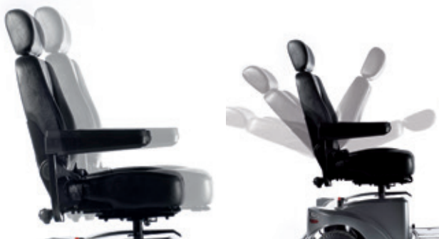
Asiento deslizable, ajustable en profundidad y respaldo ajustable en ángulo

Asiento y respaldo acolchado de gran calidad para ofrecerte el máximo confort en cada viaje. La unidad de asiento es ajustable en altura, ángulo y profundidad y los reposabrazos pueden ajustarse en anchura, ángulo y profundidad o abatirse totalmente para facilitar el acceso.