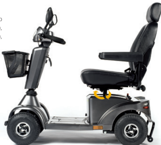
Asiento giratorio que hace más cómodas las transferencias