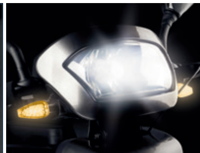
Luces delanteras e intermitentes