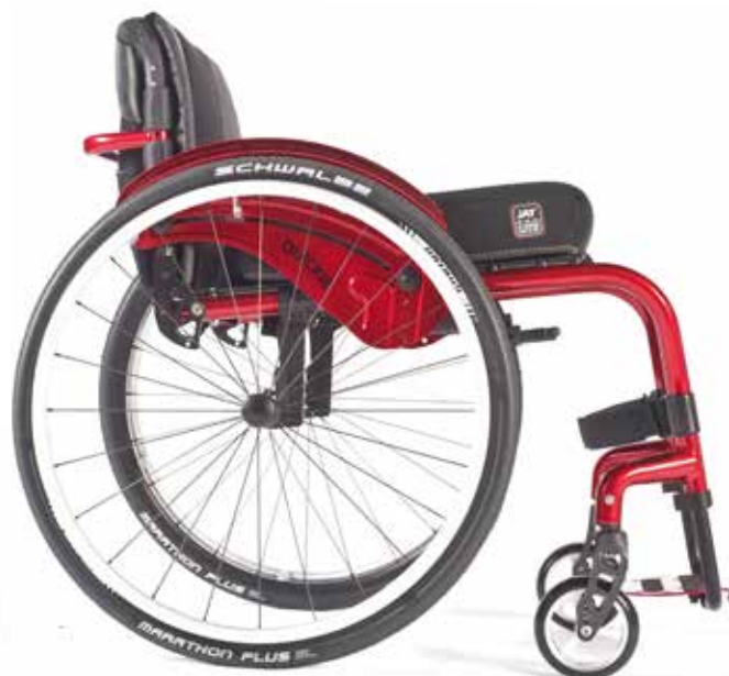
Argon 2 - Robusta y resistente. Lo último en adaptabilidad

Argon 2 ha conseguido aunar en una sola silla las ventajas de un chasis rígido y de una silla ajustable. La rigidez que le confiere su estructura fija, junto con las posibilidades de regulación de la silla, convierten a la Argon 2 en la compañera ideal para tu vida activa. Todo ello en un diseño de armazón abierto y con una estética más moderna y deportiva que nunca.