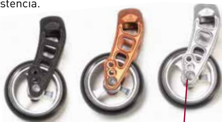
Ajustes de la altura delantera de asiento

La búsqueda de nuevos materiales y tecnologías ha sido clave en el desarrollo de la Argon 2 . El material utilizado en las horquillas es Carbotecture - un material de fibra de carbono extremadamente fuerte y ligero, con una gran resistencia a los impactos. El diseño curvado del tubo de la horquilla se ha conseguido mediante la técnica del Hydroforming , que permite obtener geometrías complejas del tubo con la mayor resistencia.