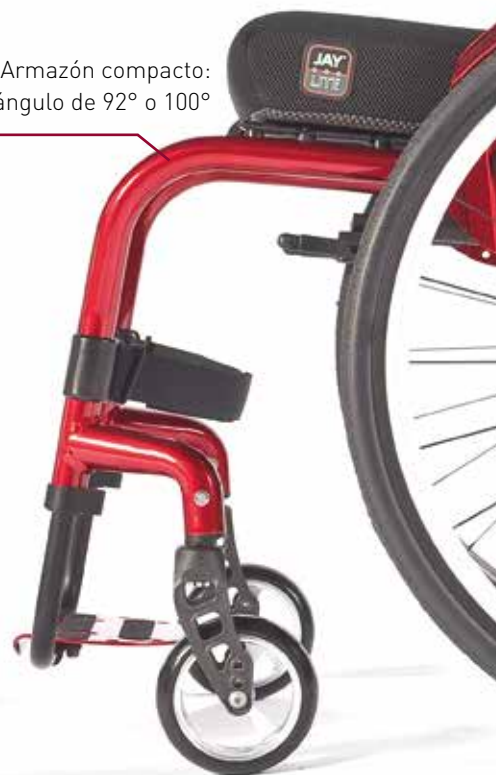
> Diseño innovador del armazón frontal . Moderno y con una gran resistencia.