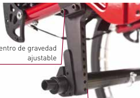
Ajustes de la altura de asiento trasera y del ángulo de asiento