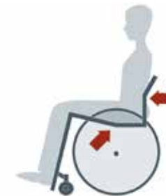
El diseño del asiento ergonómico con su sección en cuña y su sección horizontal optimiza la estabilidad pélvica, facilita la propulsión de la silla y minimiza la fricción para proteger la piel.