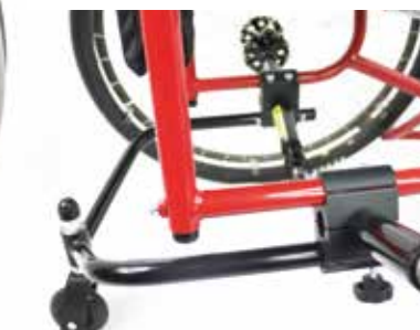
Centro de gravedad ajustable y antivuelco extraíble