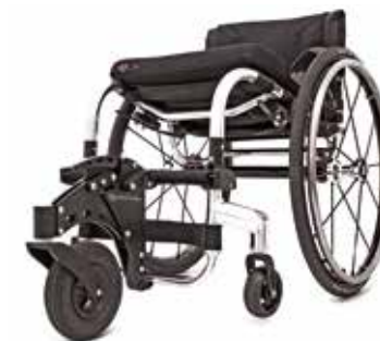
Rueda frontal todoterreno. Máxima libertad y facilidad de propulsión en todas las superficies. Compacta y muy fácil de instalar, incluso con el usuario en la silla. Compatible con Tiga, Tiga FX y Hi Lite.