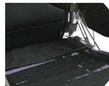
Tapicería de asiento transpirable y ajustable en tensión; con hebillas de titanio