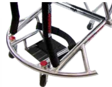
Horquilla de aluminio integrada, resistente y ligera.

Y además, ruedas delanteras con rodamientos Bones Reds como standard. Reducen la fricción, minimizando la energía necesaria para propulsar la silla y facilitando la maniobrabilidad en el juego.