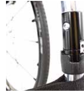
Sistema de plegado "Q lock" armazón frontal