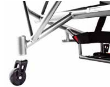
Antivuelco integrado con ajuste en altura (unidad o doble)