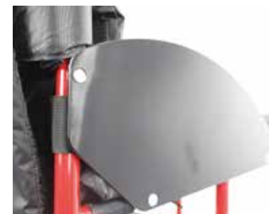
Protectores laterales de aluminio