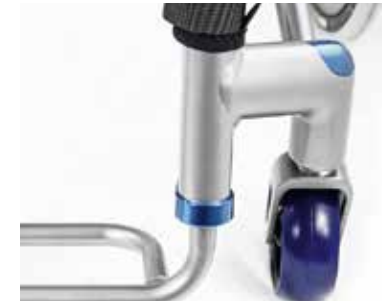
Detalles anodizados en color