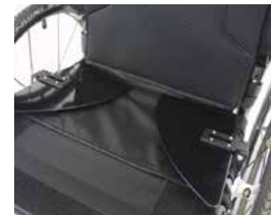
Protectores laterales plegables "Fold flat"