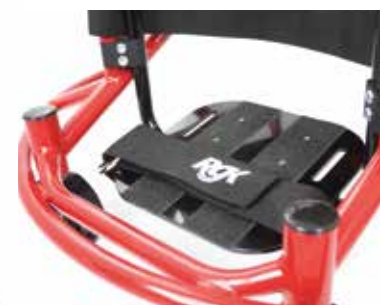
Reposapiés ajustable en altura y ángulo