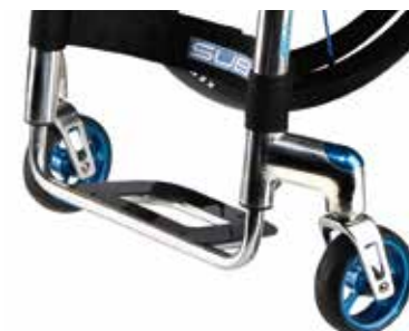
Plataforma reposapiés ligera de carbono