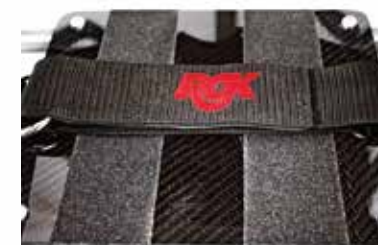
Reposapiés integrado con cincha pies

Y además, ruedas delanteras con rodamientos Bones Reds como standard. Reducen la fricción, minimizando la energía necesaria para propulsar la silla y facilitando la maniobrabilidad en el juego.