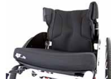
Soportes laterales ajustables integrados. Estabilidad lateral extra para garantizar el posicionamiento de columna en la línea media. Prevención de actitudes escolióticas y su progresión.