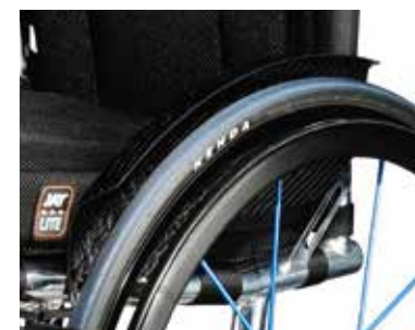
Protectores laterales ligeros de carbono con fender