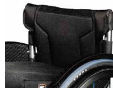
Tapicería de respaldo Air Tech optimizada. Ajustable en tensión y con banda central transpirable; con hebillas de titanio.