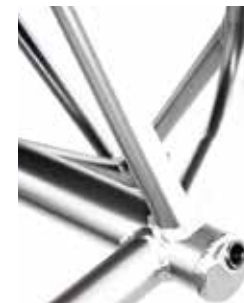
Tubo del eje integrado