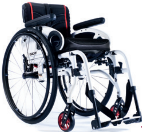
XENON 2 Reposapiés Desmontables LA MÁS VIAJERA