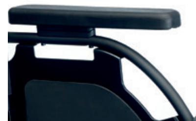
Reposabrazos de serie con almohadillado ajustable en profundidad y altura