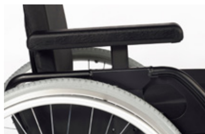
Reposabrazos ajustables en altura manualmente