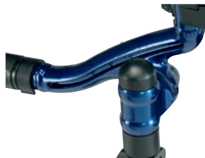
Original diseño del soporte de la horquilla

En su fabricación se han empleado elementos especialmente duraderos para conferirle rigidez, como el soporte del tubo del respaldo, las fijaciones del asiento, una firme cruceta con dos brazos y el soporte de la horquilla con sus originales formas. Todos ellos son componentes de aluminio, lo que contribuye a conseguir una silla robusta sin comprometer su peso.