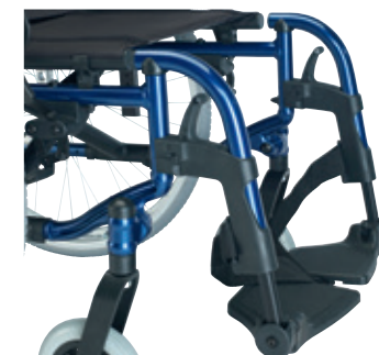
Armazón compacto con reposapiés a 80° (sólo modelo Style X Ultra)