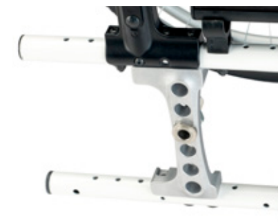
Pletina trasera y soporte del respaldo en aluminio