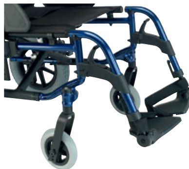
Reposapiés a 70°