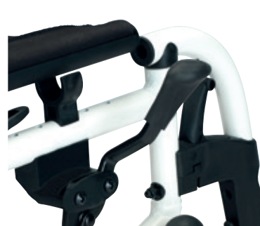
Fijaciones firmes del asiento