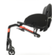
DKA1500 a DKA1540